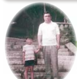
初代院長と現理事長