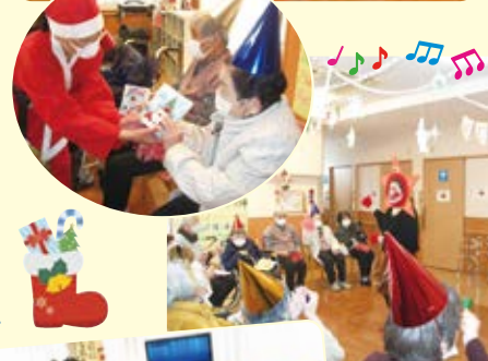
楽しい、楽しいクリスマス会! 今年もやって来ました。クリスマスソングを皆で合唱し、スタッフの思いを込めた出し物を披露しました。ケラケラと笑う姿は「童心に帰る」という言葉がピッタリです。拍手喝采で楽しい時間を過ごしました。