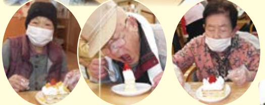
スポンジを1, 2, 3枚と重ね、上には美味しいホイップクリームを好きなだけ絞りました。最後にイチゴを飾り出来上がり。「旨い!!」という言葉が響きました。