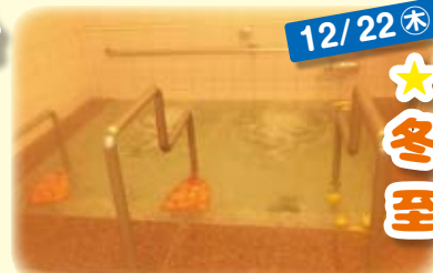
今年は柚子の代わりにレモンを浮かべ、温まりました。