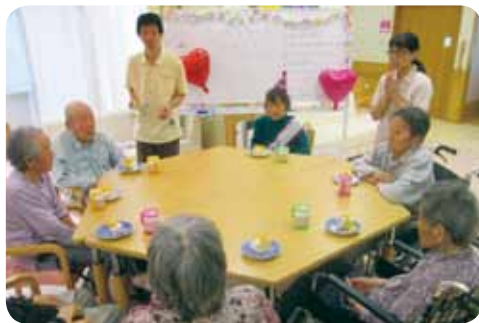
みんなで頂きます

七夕の前々日、入居者の皆さんにご協力頂き、笹に飾り付けをしました。短冊には『いつまでも、元気で居れる様に』『山』のごとき安らぎの心を育みますように』などと、いろいろな願い事を書かれていました。飾り終えた後「たなばたさま」を歌うと、皆さん懐かしんでおられました。天候はあいにく曇りでしたが、皆さんの願いが届くといいですね。