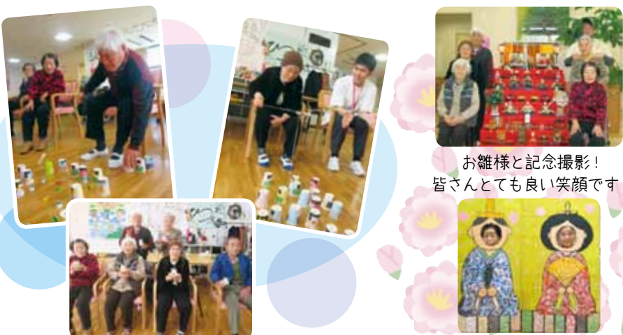
お雛様と記念撮影! 皆さんとても良い笑顔です!

3月4日(水)「ひなま釣りゲーム」を行いました。ひなま釣りゲームとは・・・?紙コップの中心に点数を書き込み、底にクリップをつけて、磁石の竿で釣る魚釣りのようなゲームです。2チームで競い合い、皆さん相手チームに負けたくない一心で、一生懸命頑張られていました。